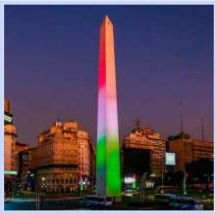
Buenos Aires, marzo 2020